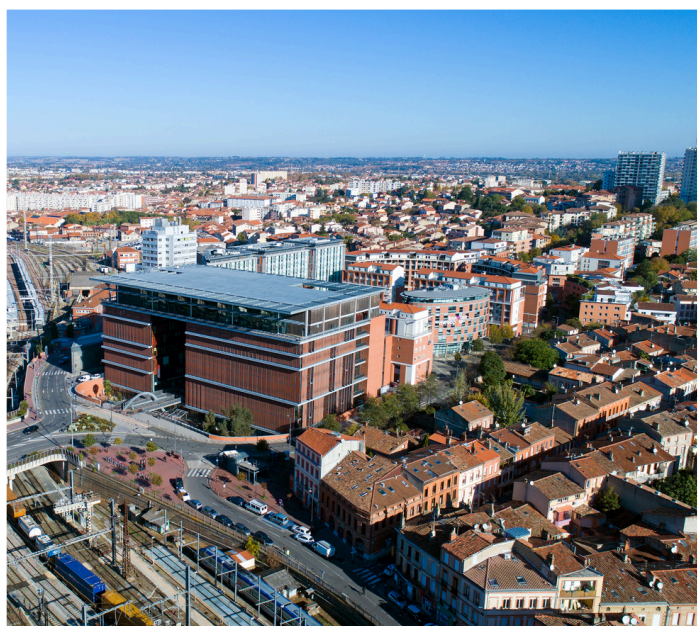
Quartier Marengo / Bonnefoy / Jolimont

Le Nouveau Printemps poursuit ainsi son soutien à des créations artistiques responsables, en dialogue avec tous les publics, ouvertes sur le monde et attentives à nos environnements.